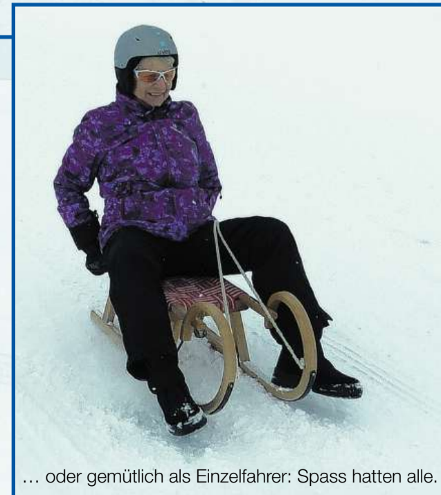
... oder gemütlich als Einzelfahrer: Spass hatten alle.