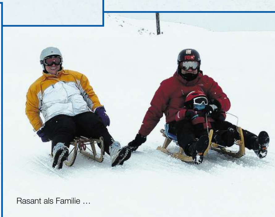
Rasant als Familie ...