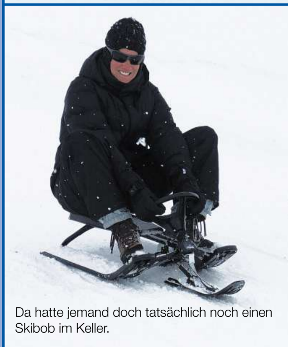
Da hatte jemand doch tatsächlich noch einen Skibob im Keller.